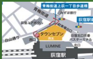
荻窪タウンセブンビル (JR中央・総武線 荻窪駅北口徒歩1分)