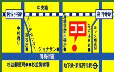
東京土建杉並支部 (地下鉄丸の内線 新高円寺駅徒歩3分 /JR中央・総武線 高円寺駅南口徒歩15分)